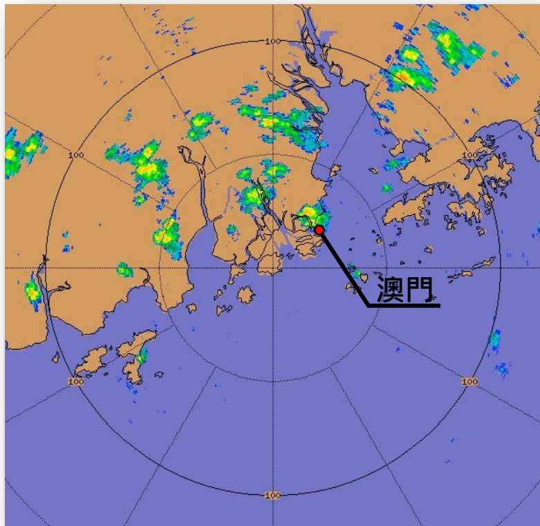
9月4日13時35分珠澳雷達回波圖